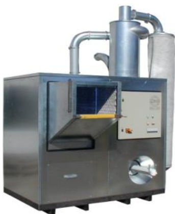
RECICLAGEM MINI "EM-UMA-UNIDADE"