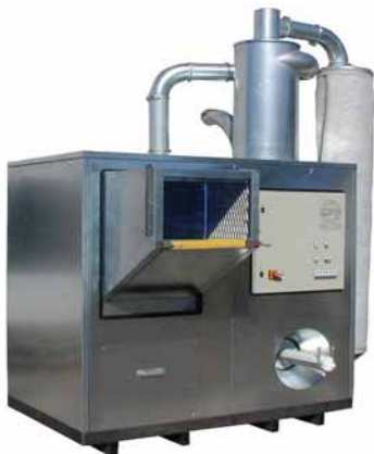
RECYCLING MINI "IN-A-BOX"