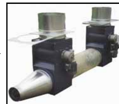
Die STYROMETER Mischstation für Blockherstellern oder vor die Druckbeladung für das EPP

Prospekten mit den ausführlichen Informationen vorhanden für jedes Produkt.