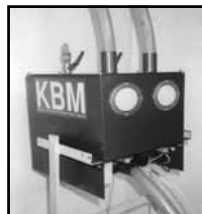
Die STYROMIX 1 Mischeinheit für Formteilherstellern