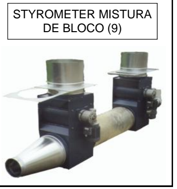
STYROMETER MISTURA DE BLOCO (9)