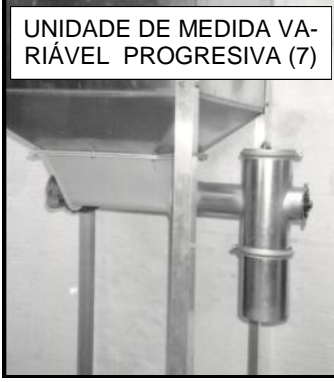
UNIDADE DE MEDIDA VARIÁVEL PROGRESSIVA (7)