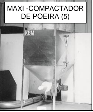
MAXI -COMPACTADOR DE POEIRA (5)