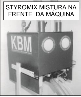
STYROMIX MISTURA NA FRENTE DA MÁQUINA