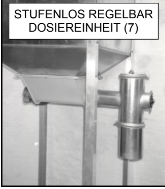
STUFENLOS REGELBAR DOSIEREINHEIT (7)