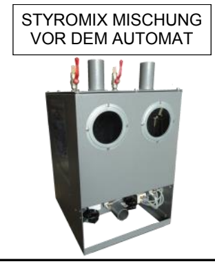
STYROMIX MISCHUNG VOR DEM AUTOMAT