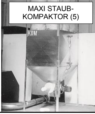
MAXI STAUB- KOMPAKTOR (5)