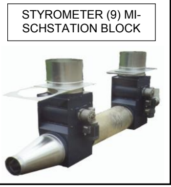
STYROMETER (9) MI- SCHSTATION BLOCK