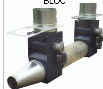
STYROMETER UNITÉ DE DOSAGE BLOC