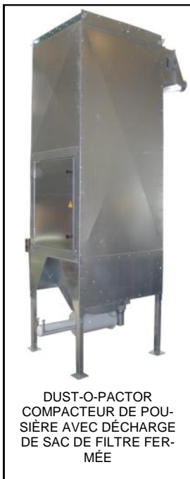
DUST-O-FACTOR COMPACTEUR DE POUSSIÈRE AVEC DÉCHARGE DE SAC DE FILTRE FERMÉE