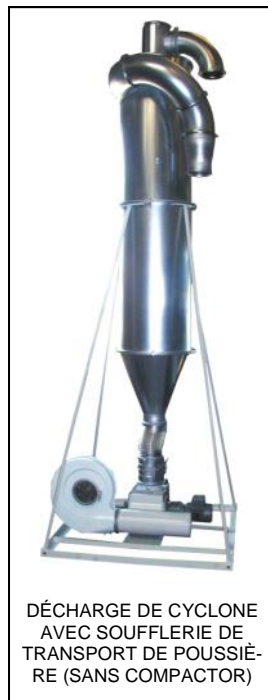
DÉCHARGE DE CYCLONE AVEC SOUFFLERIE DE TRANSPORT DE POUSSIÈRE (SANS COMPACTEUR)