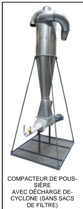
COMPACTEUR DE POUSSIÈRE AVEC DÉCHARGE DE CYCLONE (SANS SACS DE FILTRE)