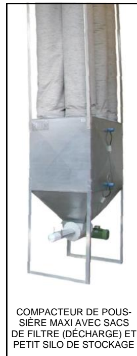
COMPACTEUR DE POUSSIÈRE MAXI AVEC SACS DE FILTRE (DÉCHARGE) ET PETIT SILO DE STOCKAGE