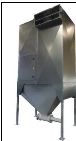
DUST-O-FACTOR COMPACTEUR DE POUSSIÈRE AVEC DÉCHARGE DE SAC DE FILTRE FERMÉE (AVEC UNE CAPACITÉ DE DOUBLE VENTILATION)