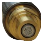
Option: Dampf-düse in der Pinole