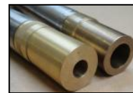
Mehrere Größen von Pinole